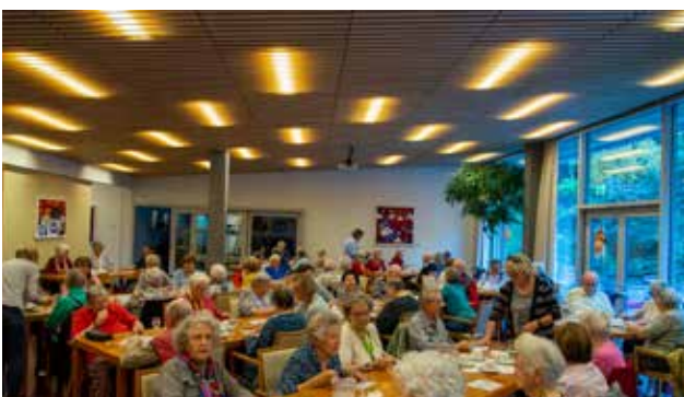
Der Lottonachmittag vom katholischen Frauenverein Chur erfreute sich grosser Beliebtheit.