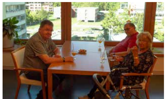
Das Aktivierungsteam mixte zur Abkühlung an Hitzetagen erfrischende Cocktails.