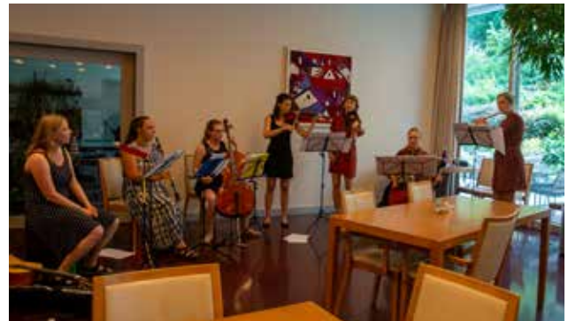
Schülerinnen der Musikwoche Tamins konzertierten in den Sommerferien auf klassischen