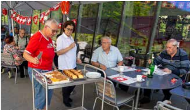
Rollendes Kuchenbuffet mit vielfältiger Auswahl zur 1. August-Feier auf dem Bodmerplatz.