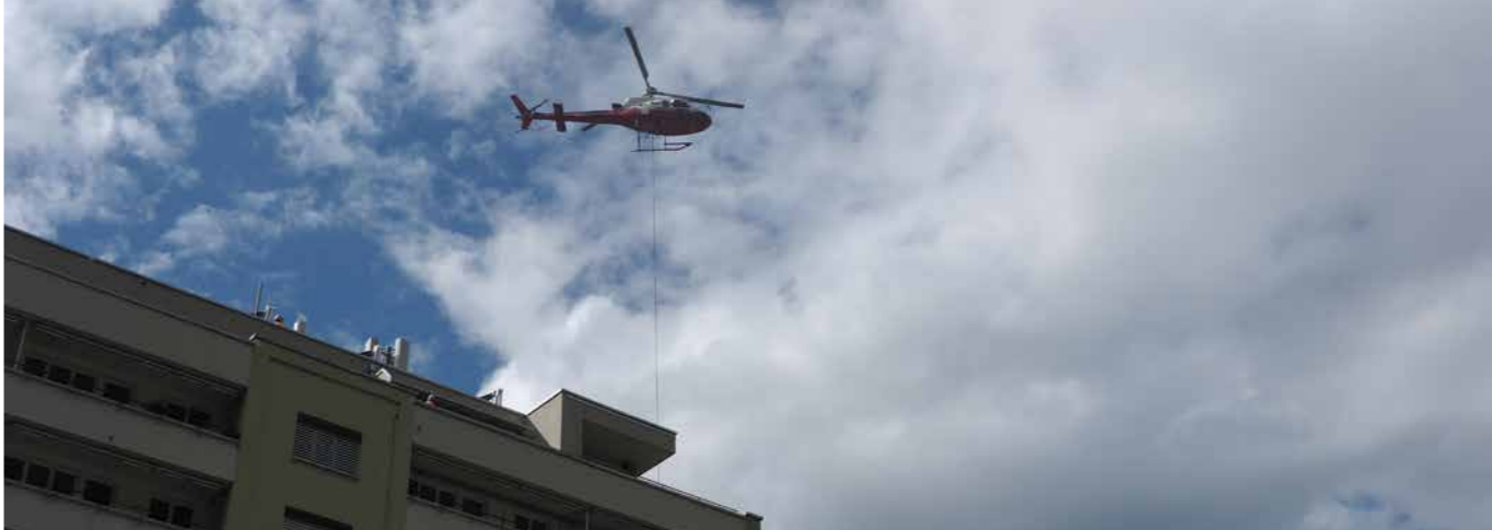
Per Helikopter wird der neue Lift im Hochhaus angeliefert – der alte tritt gleichzeitig den Rückflug an