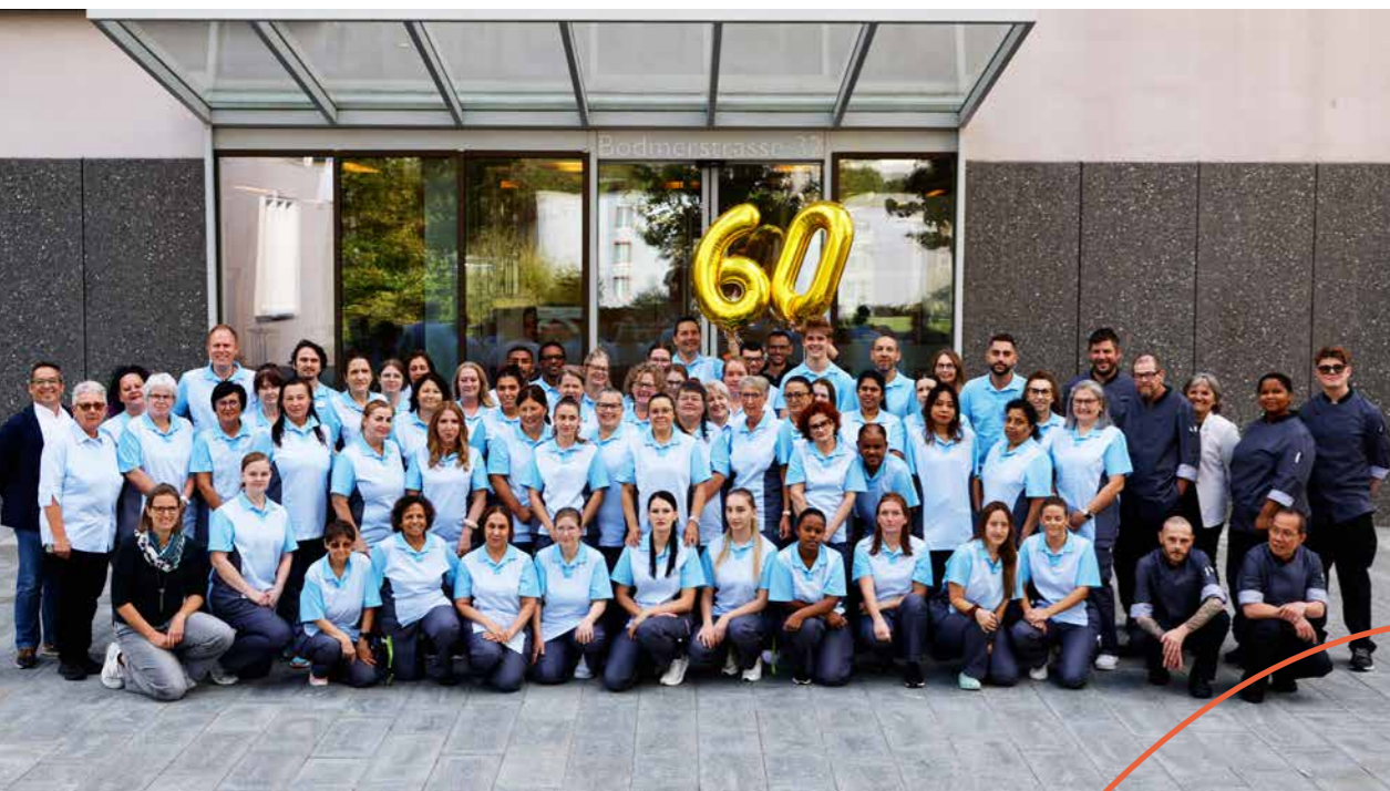
Tag des Wandels und des Feierns am 01. Oktober 2025

Dieses Jubiläum ist ein Dank an alle Mitarbeitenden. Sie gestalten Tag für Tag ein Zuhause, in dem Menschen in Würde leben und sterben können. Die Geschäftsleitung sagt: «Danke für euren Einsatz, eure Herzlichkeit und Professionalität. Lasst uns mit Vertrauen nach vorn blicken – auf viele weitere Jahrzehnte echter Menschlichkeit im Bodmer».