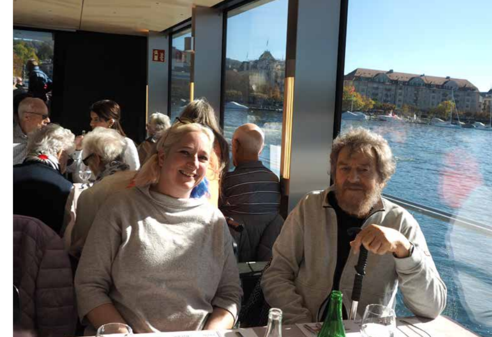
Genussvoller, sonniger Herbsttag auf und am Zürichsee