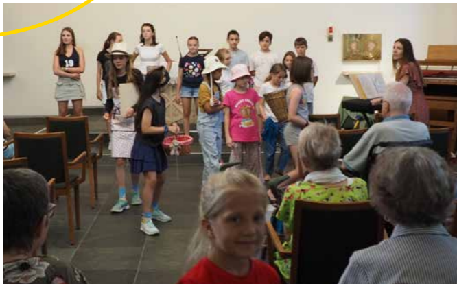
Junge Stimmen Kammerphilharmonie