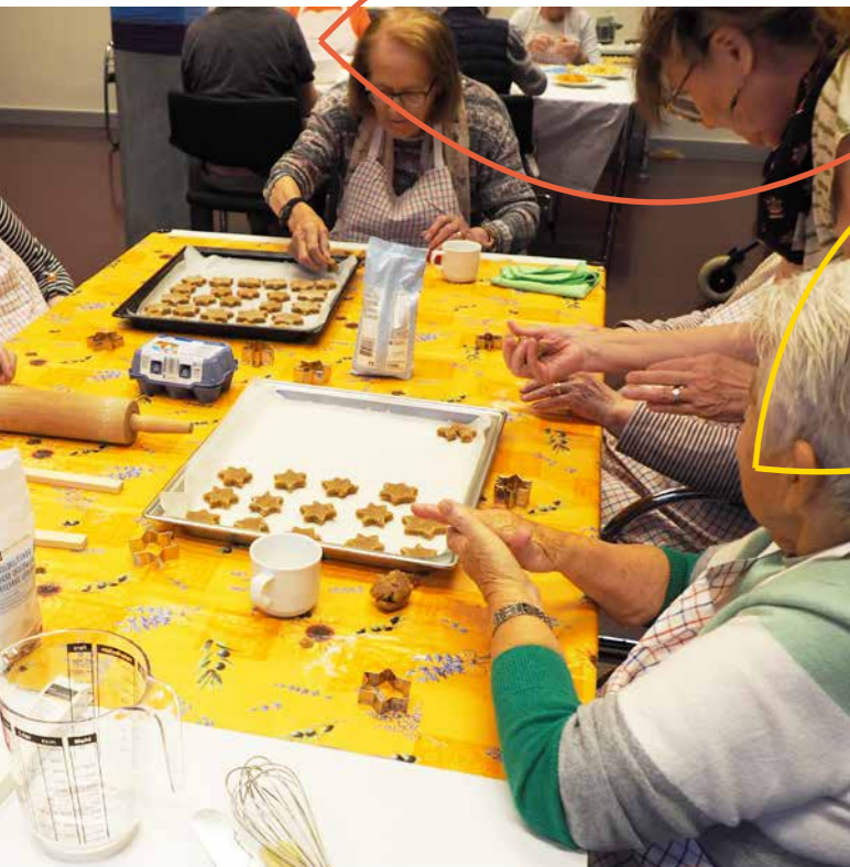
Guetzliproduktion in der Aktivierung